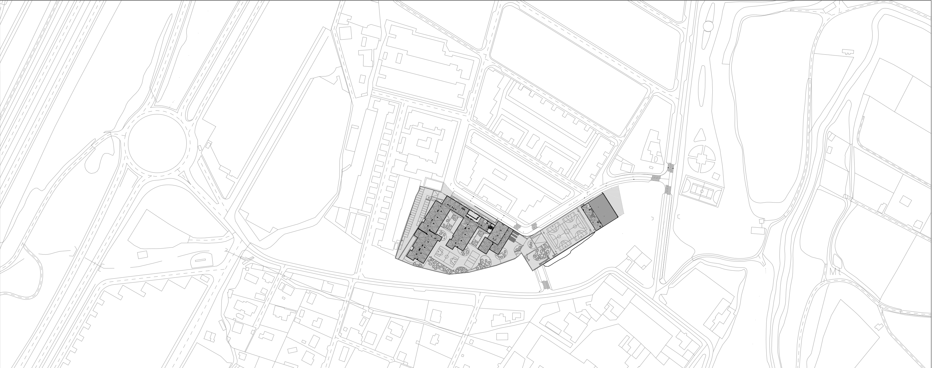
EMPLAZAMIENTO esc 1/2500